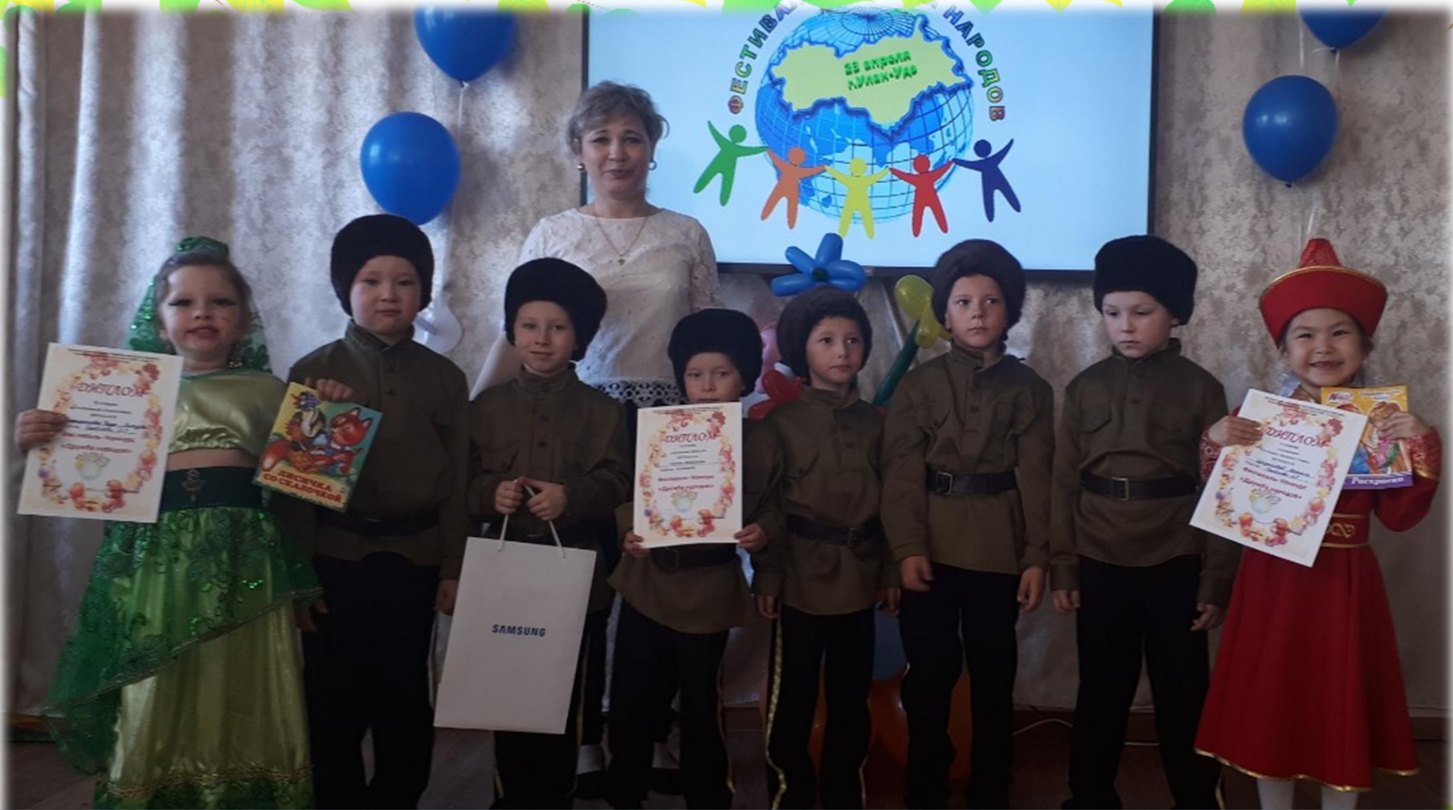
Фестиваль Дружат дети всей планеты